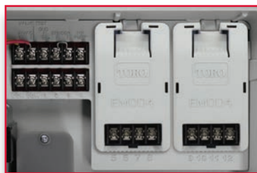
Configuración de 12 estaciones con 2 módulos de 4 estaciones