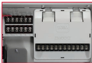
Configuración de 16 estaciones con 1 módulo de 12 estaciones